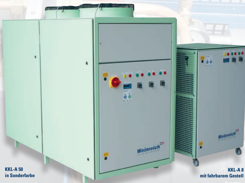
KKL-A 50 in Sonderfarbe