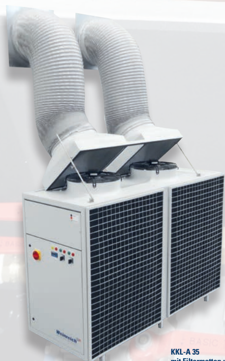
KKL-A 35 mit Filtermatten und manuell verstellbarer Abluftanlage