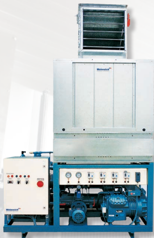
KKL-R 130 mit Jalousieklappen