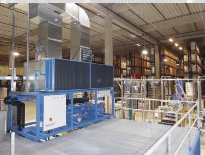
KKL-R 150 mit Stahlpodest montiert