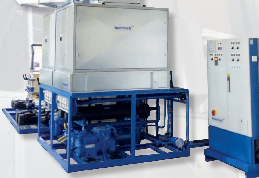
KKL-R 150 mit Umluft / Fortluftanlage